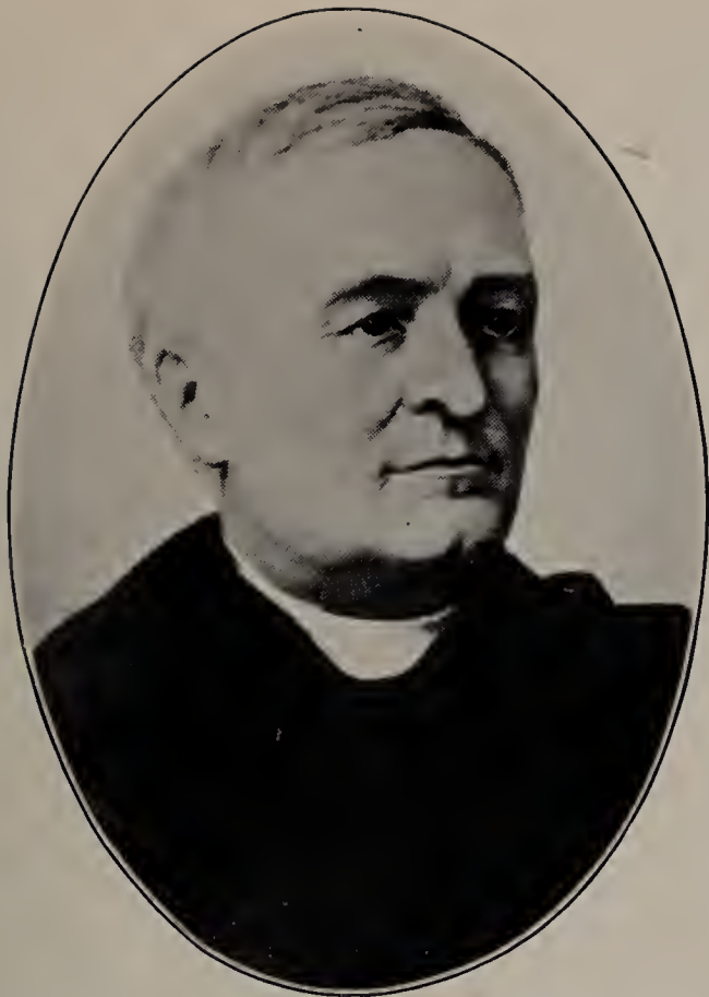
LE T. R. P. EMMANUEL D'ALZON Fondateur des Pères Augustins de l'Assomption