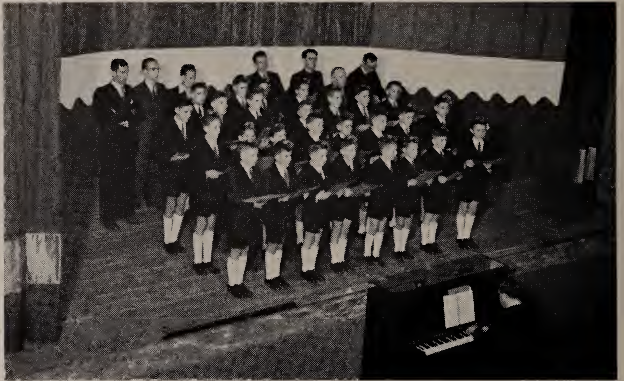
LES PETITS CHANTEURS DE LA COTE D'AZUR